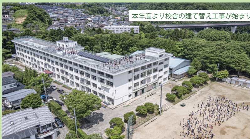
本年度より校舎の建て替え工事が始まります