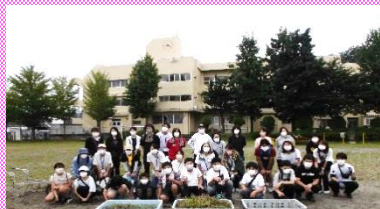
こんなに草がとれました！