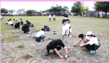
みんながんばりました！

校庭の環境整備と6年生の陸上記録会の練習を気持ちよく行えるように、毎年夏休み明けに行っています。今年は8月27日【土】に行いました。