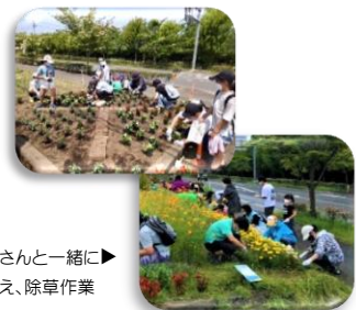
地域の皆さんと一緒に! 行う花植え、除草作業

PTA と地域、児童、学校が連携し、錦ヶ丘の花壇を整備しています。地域の方たちとの作業を通して絆を深めながら、自分たちの住む街を美しくしていこうという気持ちを育てています。