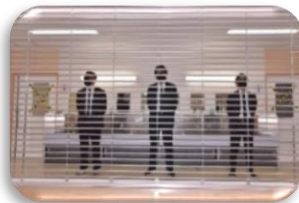
▲先生ハンター vs 子どもたちの熱い真剣勝負が繰り広げられます!

PTA が主催し、先生方・地域団体にご協力いただき、安全確保・感染防止対策に努めた上で、児童に心から楽しんでもらえるように、気持ちを込めて企画しています!