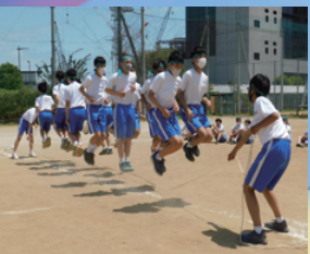
校内スポレク大会

昭和 22 年 6 月制定。外側の波形は流れる清水、五角形は五つの橋桁を示し、橋の脚と「中」の字が外に開いているのは、五橋中の限らない発展を意味します。輪郭の曲線は平和を表現しています。