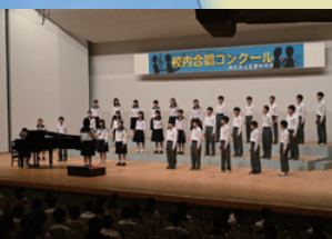
校内合唱コンクール